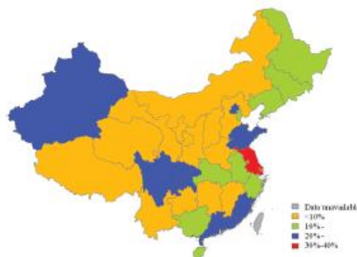
شکل 4. پوشش طرح بیمه پزشکی پایه مبتنی بر کارمند شهری / مبتنی بر سکنه در بین 170904 مهاجر داخلی روستا به شهر بر حسب سکونت استان فعلی در چین، 2014.

به طور کلی، مهاجران داخلی روستا به شهری که در چین مرکزی زندگی می کردند، دارای پایین ترین نرخ بیمه نشدگان بیمه سلامت اجتماعی (میانگین = 6.9\% ( SD=2.2\% )) در مقایسه با مهاجران داخلی بودند که در چین شرقی ( 17.3\% ( 5.8\% )) و چین غربی ( 10.9\% ( 8.7\% )) زندگی می کردند (شکل 2). پوشش NCMS در شرکت کنندگان از چین غربی ( 74.1\% ( 12.2\% )) و چین مرکزی ( 77.8\% ( 4.4\% )) نسبت به چین شرقی ( 66.8\% ( 6.3\% )) بالاتر بود (شکل 3). با این حال، چین شرقی دارای بالاترین پوشش URBMI/UEBMI ( 19.5\% ( 8.8\% )) در بین سه منطقه ( 9.0\% برای چین مرکزی، SD=4.1\% ؛ 11.3\% برای چین غربی، SD=8.0\% ) بود (شکل 4).