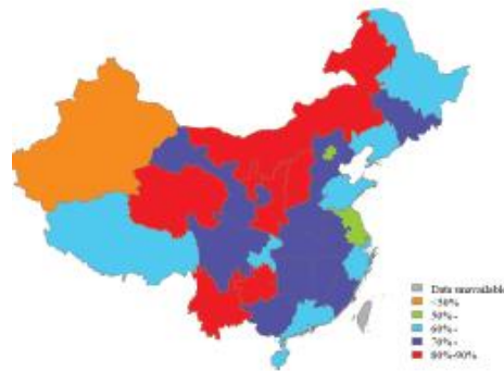
شکل 3. پوشش طرح پزشکی تعاونی روستایی نوین در بین 170904 مهاجر داخلی روستا به شهر از طریق استان فرستنده در چین، 2014.