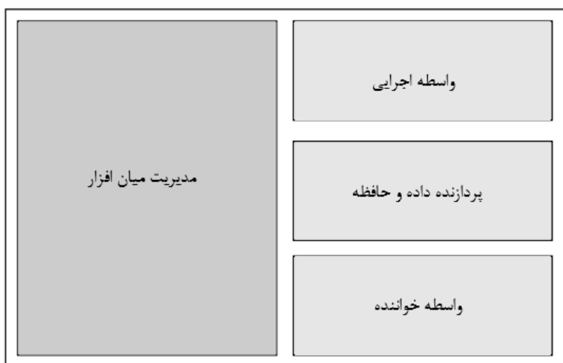
شکل 1.2. ساختار کلی جزء میان افزار