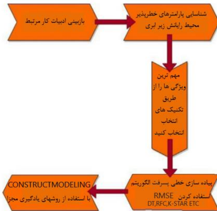
شکل ۲. روش مورد استفاده برای ساخت مدل پیش بینی پیشنهادی.